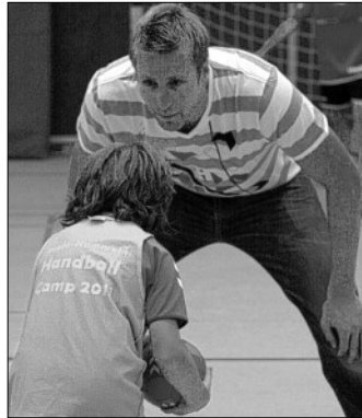
Wo ist die Lücke? ...