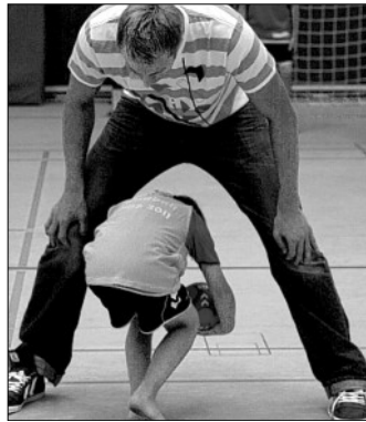
Da ist sie ...