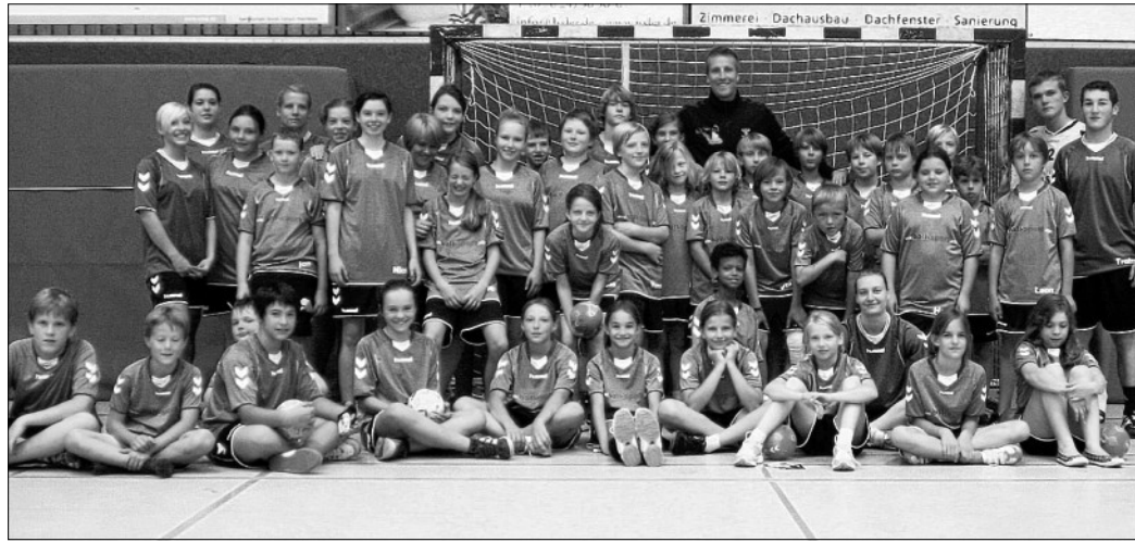
Gruppenbild mit Trainern und Stargast.