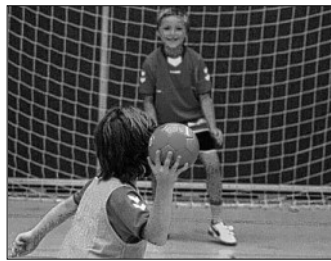
Geschafft, und nun der Torwurf.