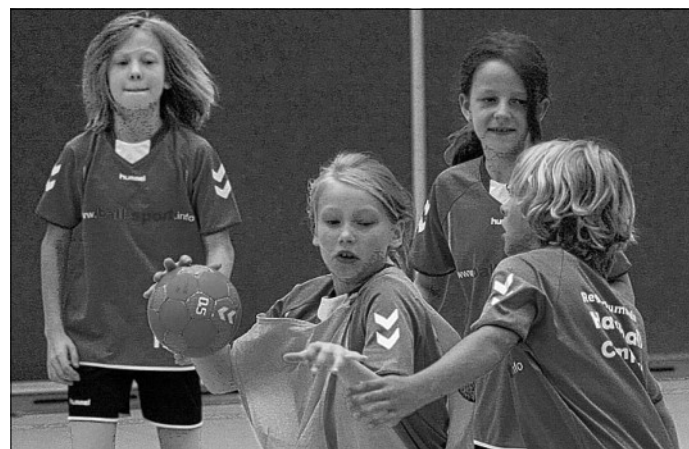
Im Camp sind die Kids mit Freude bei der Sache.